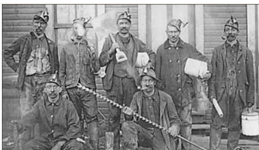
Minatori di Erbezzo nell'Ohio, meta ambita alla fine dell'800 per chi cercava lavoro

È la sintesi che Canteri mette a conclusione del libro vissuto come viaggio, itinerario alla scoperta delle radici perché se le due esperienze letterarie precedenti centrate sulla Lessinia («Il pane dei Cimbrì» e «L'arciprete») raccontano chi eravamo e la vita di quelli che sono rimasti, «Il ponte sugli oceani» alza il velo su quello che siamo diventati e su cosa saremo.