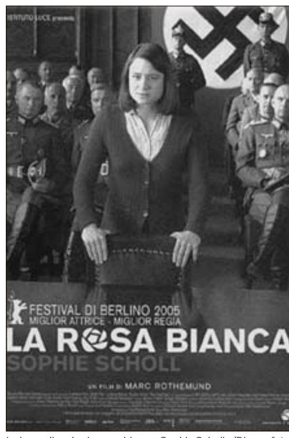
La locandina de «La rosa bianca, Sophie Scholl»

La mostra si basa su documenti originali e testimonianze dirette raccolti in grandissima parte da Inge Scholl, sorella di Sophie e Hans, morta nel 1998, che - segnata profondamente dal sacrificio dei fratelli e dei loro amici - prese su di sé il compito di consegnarlo alla memoria.